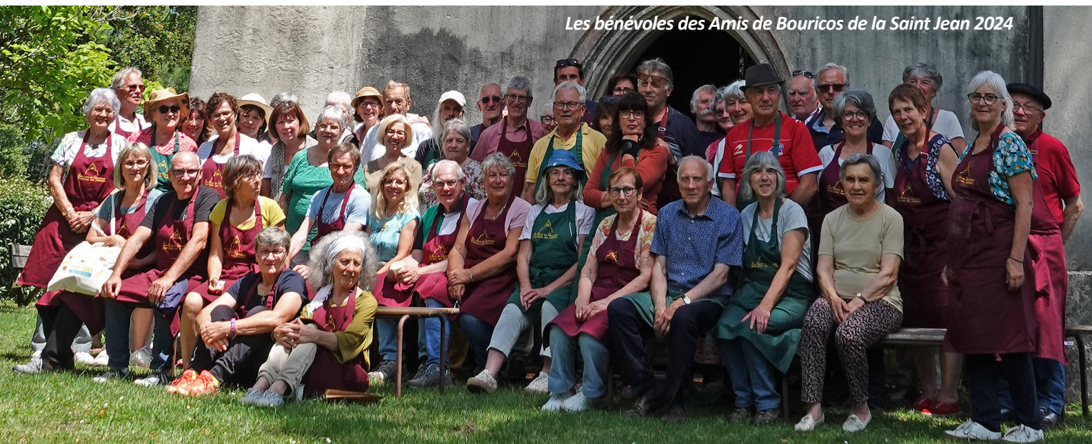
Les bénévoles des Amis de Bouricos de la Saint Jean 2024